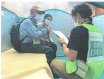
アセスメント(巡回訪問調査)