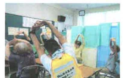
集いの場(ふれあいサロン活動)