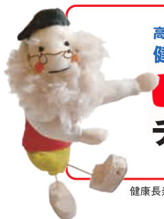
健康長寿センターキャラクター wlc (ウルク)さん